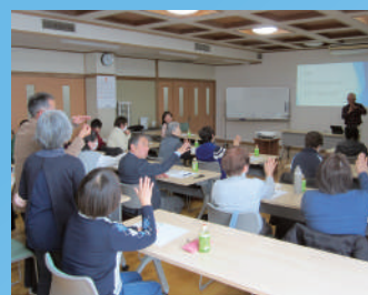
▲自分の名前を練習しています！

障がいのあるなしにかかわらず、お互いの人格と個性を尊重しあえる「地域共生社会」を目指して、手話および聴覚障がいについての理解を深めるとともに、手話を活用したコミュニケーション技術の習得を目的に手話ボランティア養成講座を開催しました。