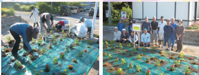
▲亀岡ボランティアサークルもんじゅの花植えの様子▲

花いっぱい運動は、花植えや花壇の管理など共同作業を通して地域住民同士のつながりを深めるとともにボランティア活動の促進を図ることを目的に、毎年実施しています。今年も多くの方々にご協力・ご参加いただきました。