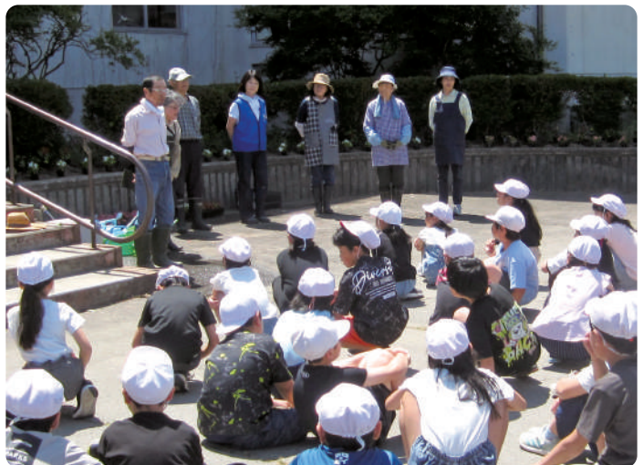
▲地域ボランティアのみなさんも一緒に参加しました。