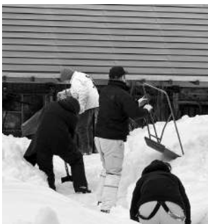
▲除排雪ボランティア活動