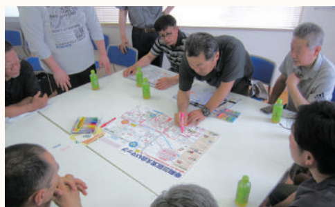
▲把握している情報をもとにマップを更新しています。