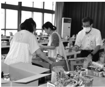
▲フードドライブたかはた