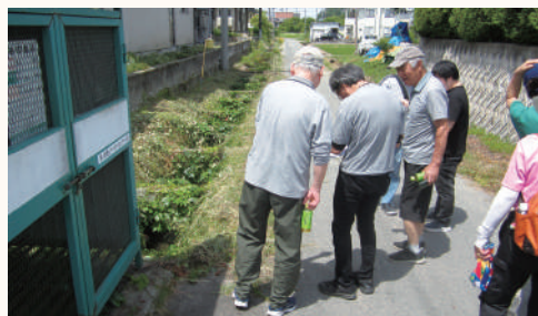
▲まち歩きをして危険箇所を確認しています。